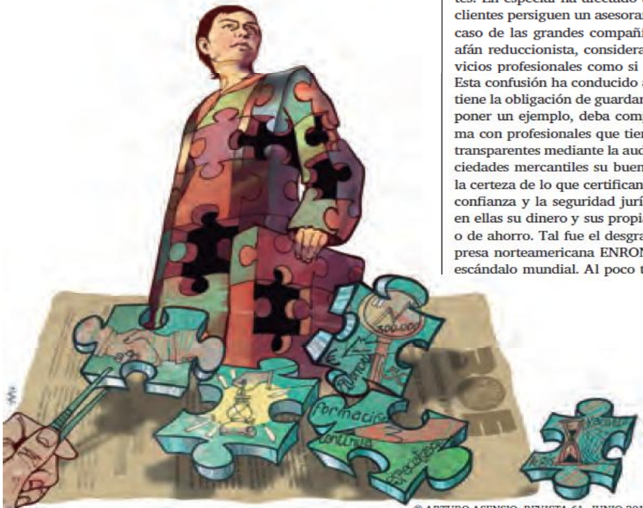
© ARTURO ASENSIO. REVISTA 61. JUNIO 2010

Como no podía ser de otra manera, la transformación social a la que hacíamos referencia con anterioridad ha afectado a la Abogacía en general y en concreto al papel de los abogados, que han tenido que adecuar a las necesidades de sus clientes las respuestas jurídicas pertinentes. En especial ha afectado a aquellos abogados cuyos clientes persiguen un asesoramiento integral, como es el caso de las grandes compañías mercantiles que, en un afán reduccionista, consideran la prestación de los servicios profesionales como si de un producto se tratara. Esta confusión ha conducido a la paradoja de que quien tiene la obligación de guardar el secreto profesional, por poner un ejemplo, deba compartir bajo una misma firma con profesionales que tienen la obligación de hacer transparentes mediante la auditoría de cuentas de las sociedades mercantiles su buen hacer, así como asegurar la certeza de lo que certifican con el fin de garantizar la confianza y la seguridad jurídica de quienes depositan en ellas su dinero y sus propias expectativas de negocio o de ahorro. Tal fue el desgraciado caso de la gran empresa norteamericana ENRON que causó un verdadero escándalo mundial. Al poco tiempo el Tribunal de Jus-